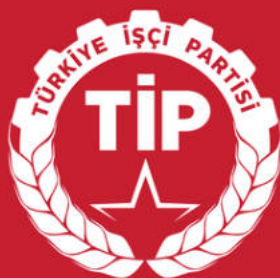
Stranická vlajka TİP

Osobně bych řekl, že nejdůležitějším rozdílem je náboženství, sociální kultura a politická historie mezi EU a Tureckem. Proto nevěřím, že je v integraci do EU nějaký pokrok. Mezi námi by však měly existovat trvalé obchodní, právní a pracovní vazby.