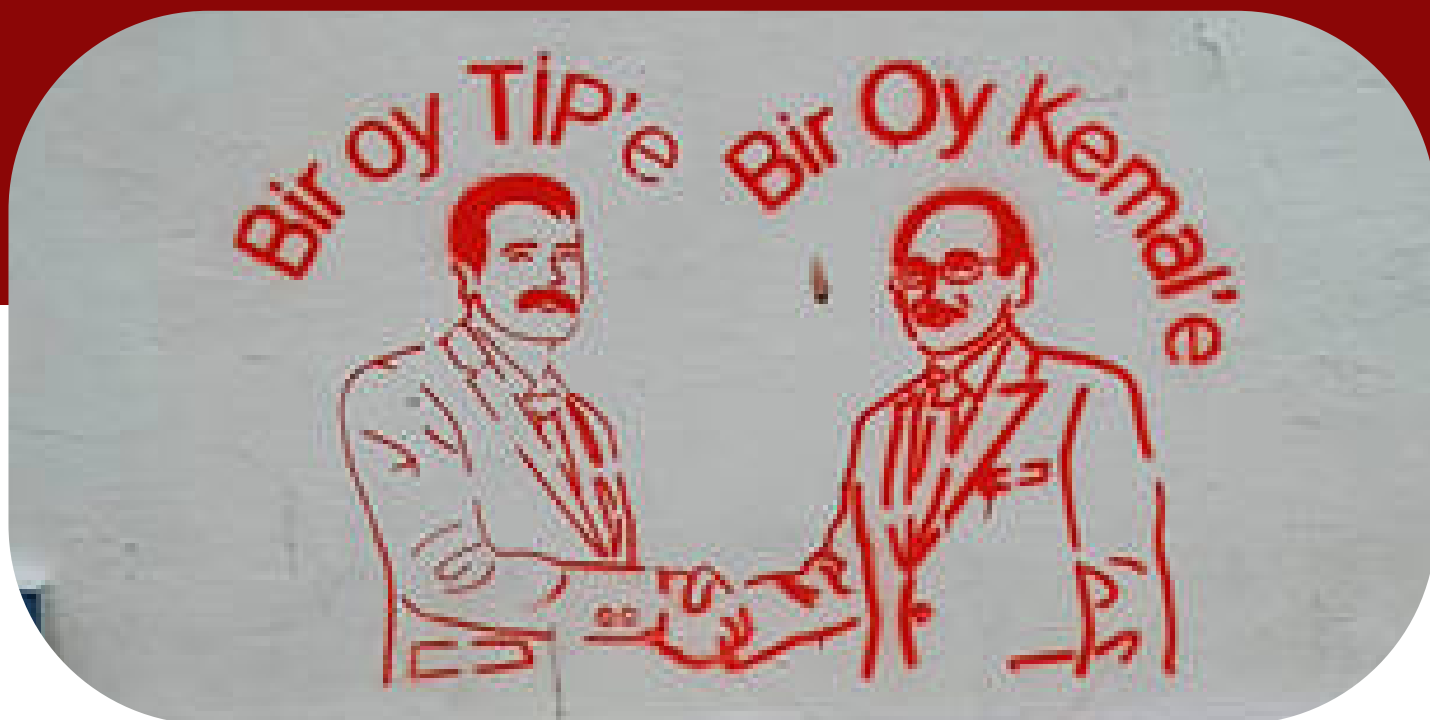
Volební heslo TIP na zdi

V souvislosti s nedávno proběhlými parlamentními a prezidentskými volbami v Turecku přinášíme rozhovor s členem české pobočky Strany tureckých pracujících (Türkiye İşçi Partisi – Çekya). Se soudruhem a soudružkou z TIP jsem se setkal v Praze, bavili jsme se kromě voleb také o nedávném rozsáhlém zemětřesení v Turecku, Kurdské otázce, programu TIP a mezinárodní politice. TIP je, jako levicová, progresivní antikapitalistická strana názorově blízká naší sesterské straně Sol Parti (členice Evropské levice), jakkoli v parlamentních volbách vystupovaly na různých kandidátních listech. Věříme, že s TIP – Česká Republika bude Levice v budoucnosti dále spolupracovat.